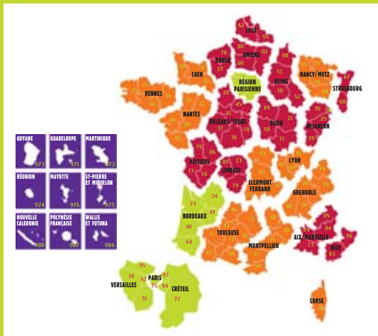
Table des académies limitrophes