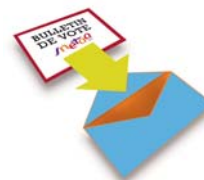
académique (matériel bleu)

2- Glisser l'enveloppe vierge cachetée dans une deuxième enveloppe sur laquelle vous porterez : Election à la CAP... des... Nom, Prénom – Grade – Signature