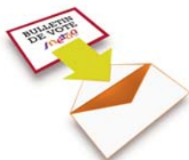
nationale (matériel blanc)

1- Mettre le bulletin de vote Snetaa-EIL correspondant à votre CAP dans l'enveloppe vierge fournie par l'administration (sans rature, ni panachage)