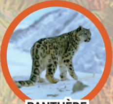
PANTHÈRE DES NEIGES